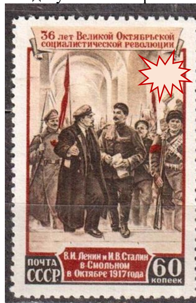
Рис. 4. Почтовая марка (изображение с закрытым хронологическим периодом для исторической задачи). Для редактирования изображения можно использовать как графический, так и текстовый редактор.