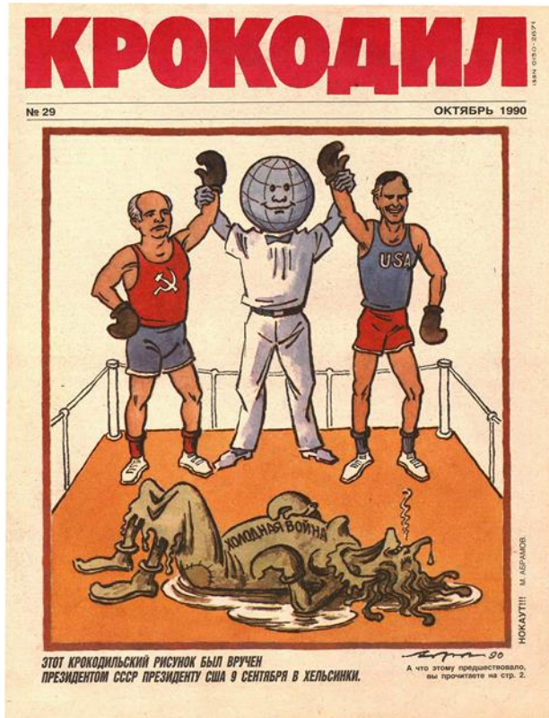
Рис.11. Обложка журнала «Крокодил», №29, 1990 г.