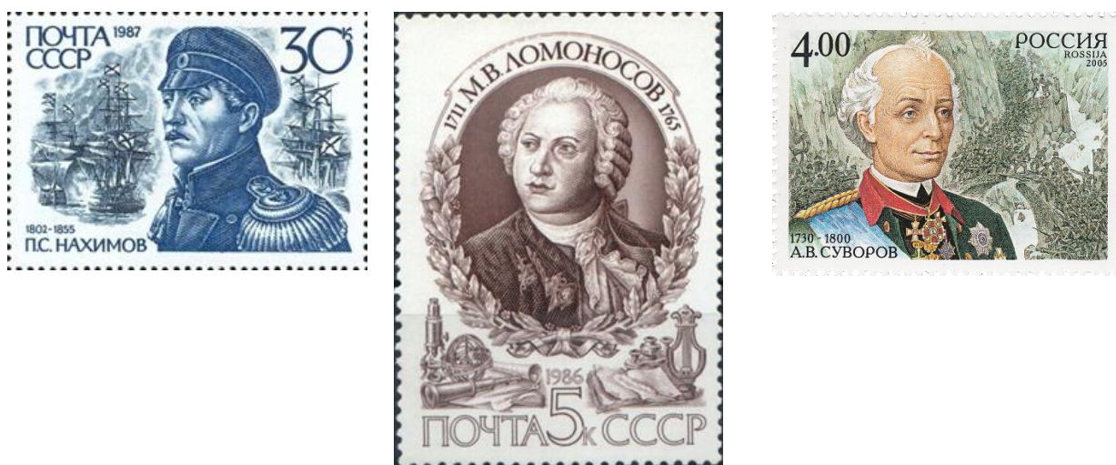
Рис.2. Примеры почтовых марок, посвященных историческому деятелю.

Почтовые марки, посвящённые историческому деятелю, как правило, содержат годы жизни, юбилей (количество лет, прошедших с рождения или смерти исторического деятеля), год выпуска марки.