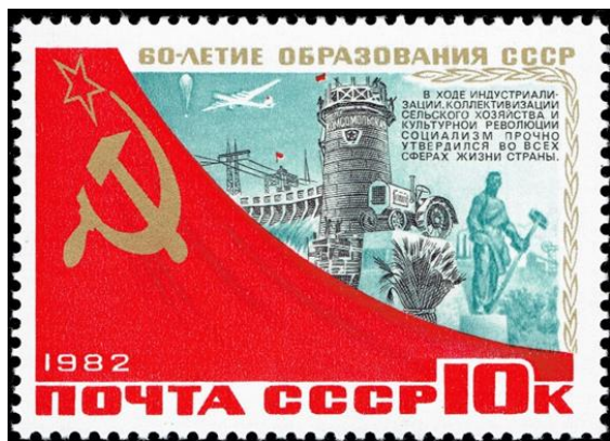
Рис. 5. Почтовая марка (реальное изображение).

Обучающиеся смогут дать правильный ответ на данную задачу не только если будут знать дату образования СССР и проведут несложный математический расчёт ( 1922 + 60 = 1982 ), но и будут знать кто руководил СССР в 1982 году.