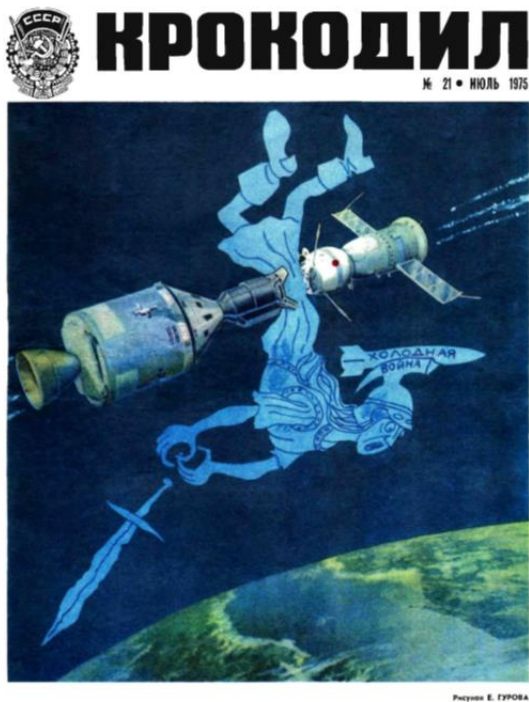
Рис.9. Обложка журнала «Крокодил», №21, 1975 г.