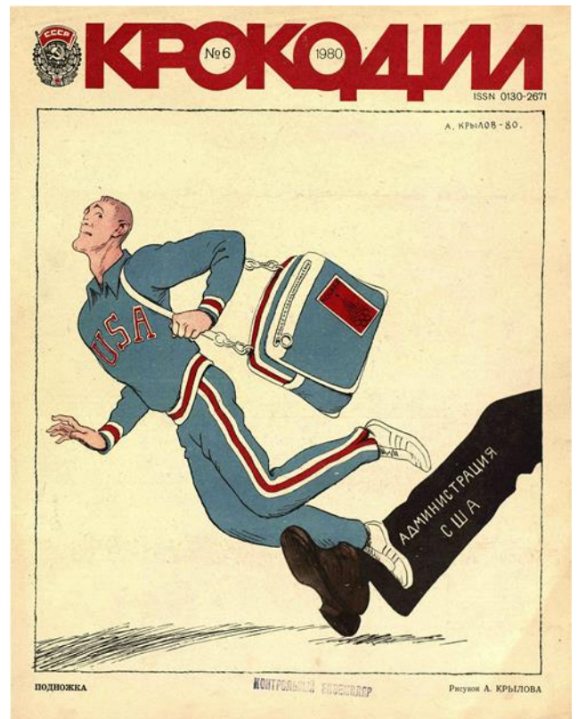
Рис.10. Обложка журнала «Крокодил», №6, 1980 г.