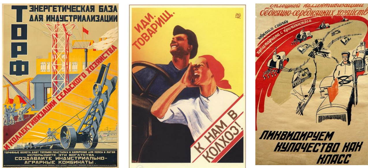
Рис. 13. Агитационные плакаты времен коллективизации.

Агитационный плакат – жанр универсальный, самый массовый и общедоступный вид изобразительного искусства. Специфика художественного языка плаката проста и лаконична.