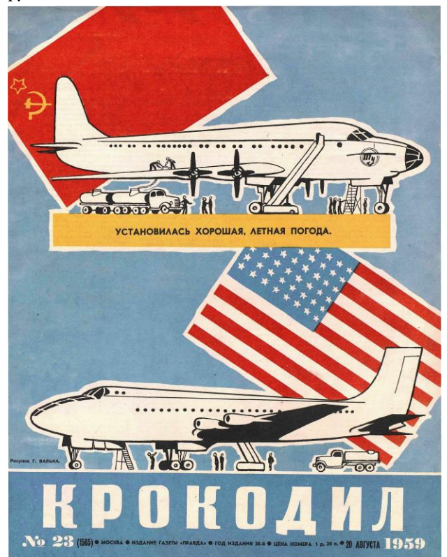
Рис.12. Обложка журнала «Крокодил», №23, 1959 г.