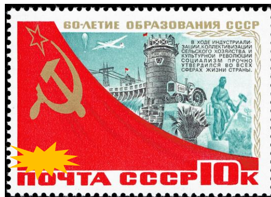
Рис. 6. Почтовая марка (изображение с закрытым хронологическим периодом для исторической задачи).