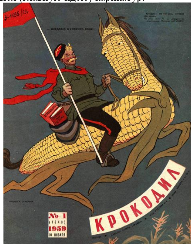
Рис. 8. Обложка журнала «Крокодил», №1, 1959 г.

Обложки, представленные на рис. 7-8, посвящены деятельности Н.С. Хрущева в области управления народным хозяйством. На иллюстрациях отображены ключевые символы («кукуруза») и слова-«маркеры» (совнархозы), характеризующие хрущевскую эпоху.