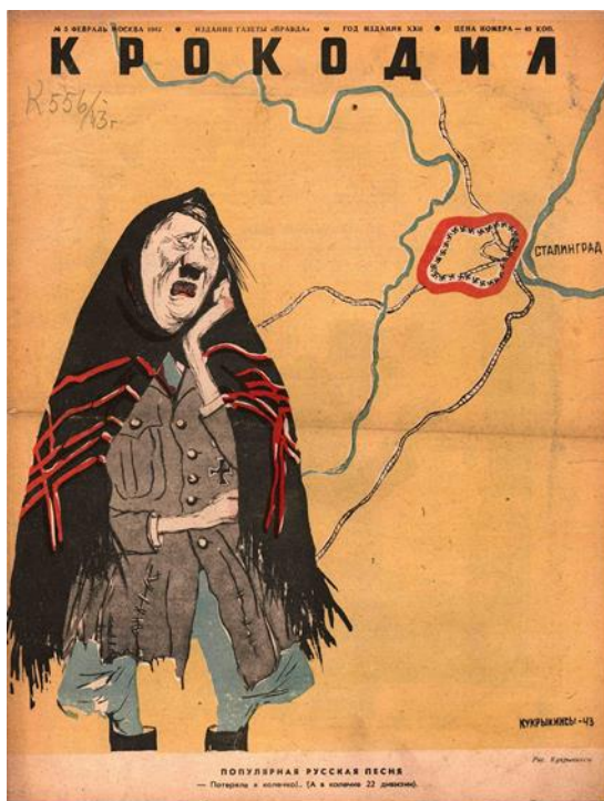
Рис. 7. Знаменитая карикатура «Потеряла я колечко (а в колечке 22 дивизии)», Кукурьниксы, 1943 г. на обложке журнала «Крокодил» №3, 1943 г.

Знаковые карикатуры были созданы в годы Великой Отечественной войны (рис.7).