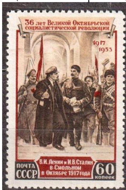
Рис. 3. Почтовая марка (реальное изображение).

Обучающиеся смогут выполнить это задание лишь в том случае, если обратят внимание на надпись на марке «36 лет Великой Октябрьской социалистической революции» и будут знать дату этого исторического события.