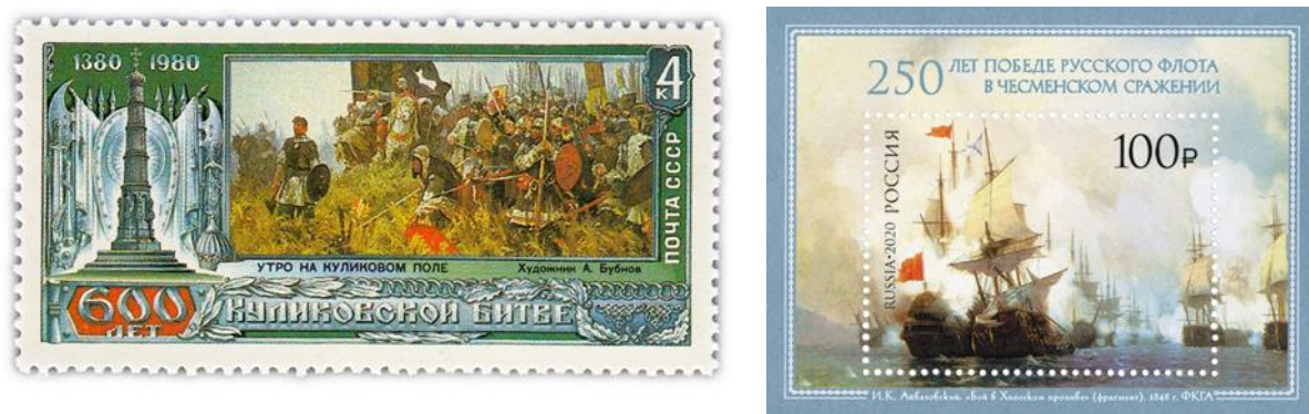
Рис.1. Примеры почтовых марок, посвященных юбилеям исторических событий.

исторического события, указание на юбилей (количество лет, прошедших с момента события), год выпуска марки (например, рис.1).