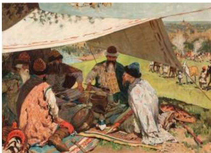
С.В. Иванов. «Съезд князей» (XI-XII вв.). 1912