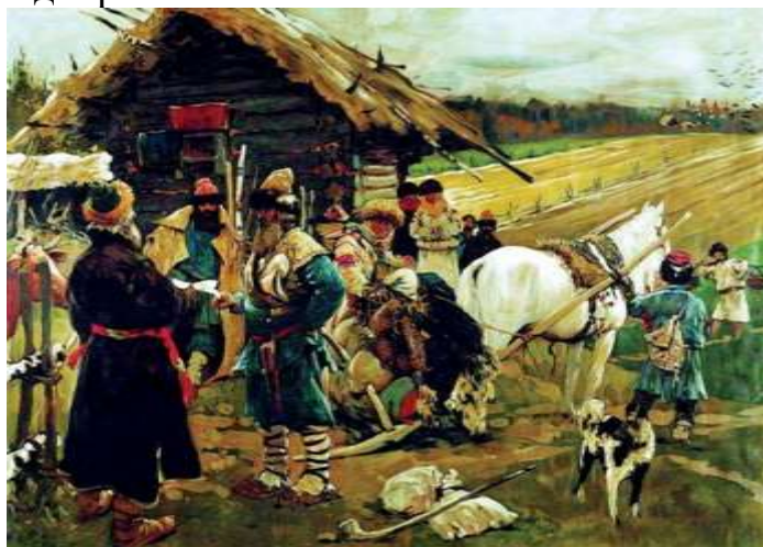
С.В. Иванов «Отъезд крестьянина от помещика в Юрьев день», 1908 г.

Данное задание предусматривает обязательное использование исторических терминов и понятий. Список исторических терминов и понятий для составления рассказа может быть предложен учителем, либо ученик их подбирает сам.