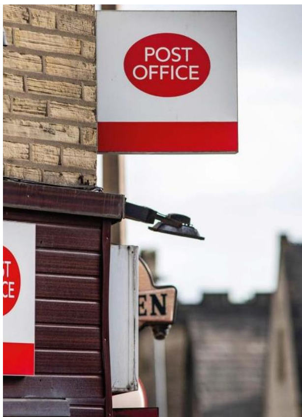
(рис. 3 фото реалии стран изучаемого языка)

Традиционными рубриками журнала являются: