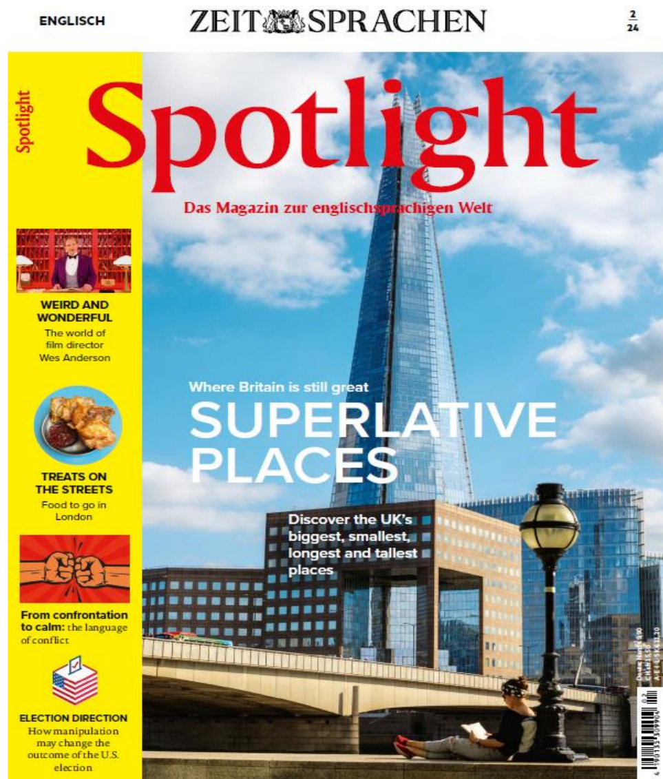
(рис.1 обложка журнала “Spotlight”, выпуск №2/2024)

Журнал издается ежемесячно, имеет определенную структуру и традиционные рубрики (рис.1).