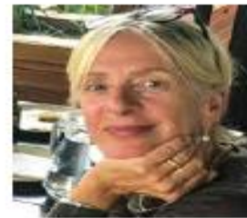
(рис.5 рубрика Films and Books)