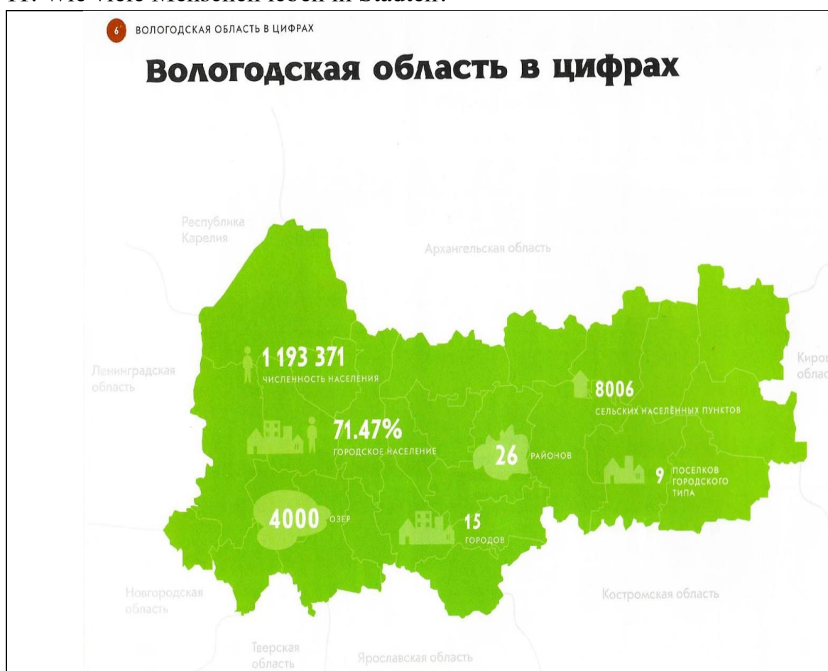
Рис.2 Вологодская область в цифрах

11. Wie viele Menschen leben in Städten?