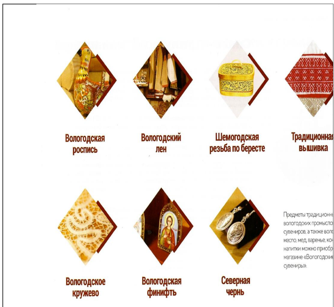
Рис.3 Традиционные вологодские ремесла и промыслы

Задание 3. Обучающимся предлагается ознакомиться с перечнем праздников и фестивалей, которые традиционно проходят на территории Вологодской области и в городе Вологде стр.63 путеводителя (рис.4)