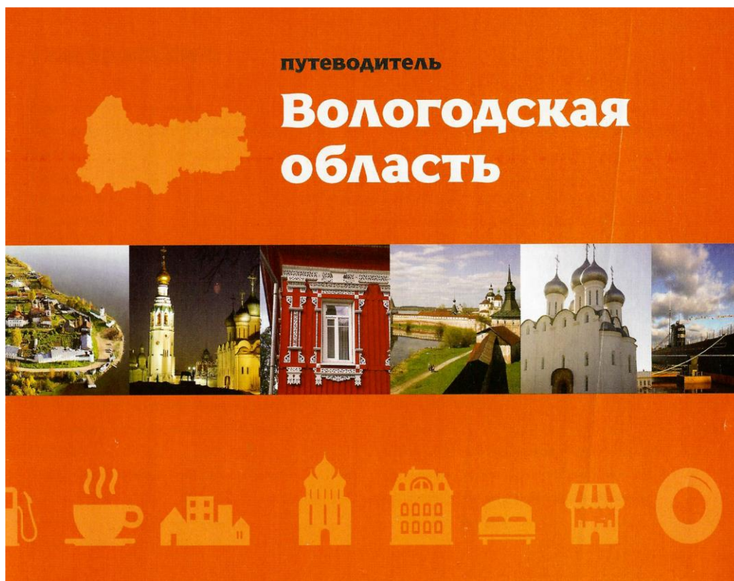
Рис.1 Путеводитель «Вологодская область»

численности населения, количестве муниципалитетов и городских округов, крупных городах. В буклете также представлена информация о водных и лесных ресурсах области, культурных объектах, популярных туристических маршрутах, традиционных ремеслах, фестивалях и праздниках, которые проводятся в областном центре и на территории области.