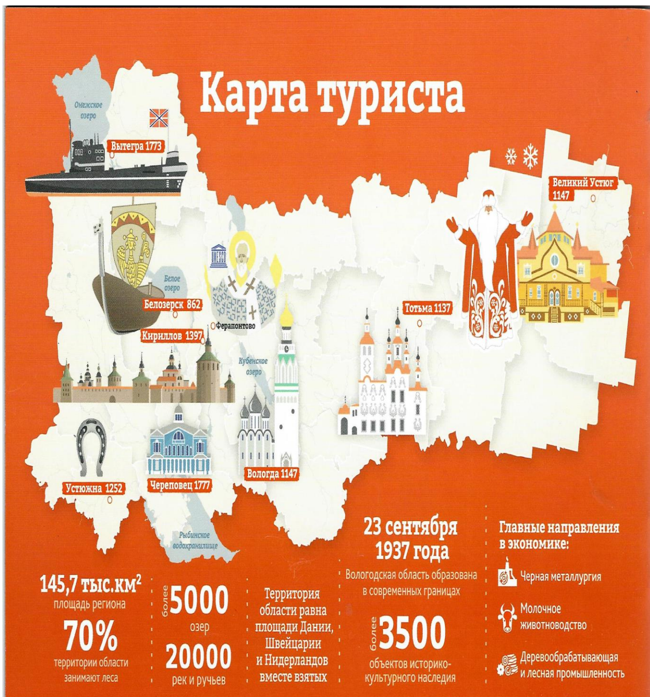
Рис. 5 Карта туриста

Задание 4. Используя материал «Карта туриста» (рис.5), обучающимся предлагается выполнить задания на числительные и даты, связанные с фактами и событиями Вологодской области.